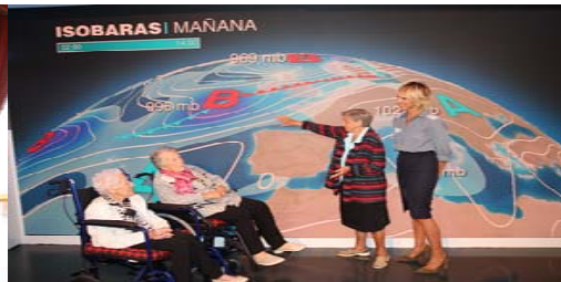
Gure egoiliarak ETBko "Eguraldia" programan